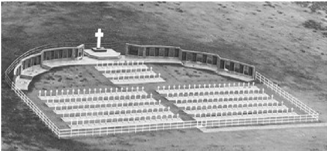
Monumento a los Argentinos Caídos en el Cementerios de Darwin Islas Malvinas – Argentina

Informe británico Lord Frank Corte Suprema de la Nación Entrevistas a Constantino David off Diarios y revistas de la época Testimonios de Veteranos de Guerra